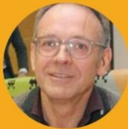
Gregor Burkhart Observatorio Europeo de la Droga y las Toxicomanías (EMCDDA)